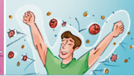
gute • Abwehrkräfte