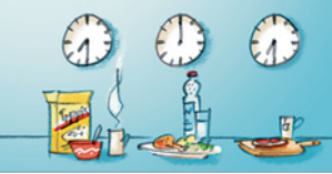
regelmäßige • Mahlzeiten