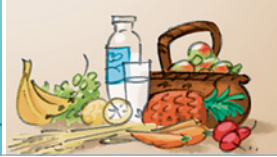
gesunde • Nahrungsmittel