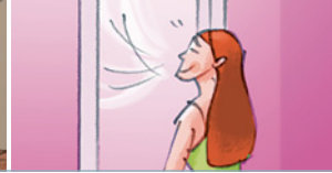
• Sauerstoff / frische • Luft