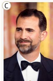
Prinz Felipe, Spanien