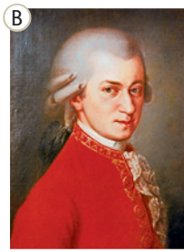
Wolfgang Amadeus Mozart, Österreich

Das ist Philipp Lahm. Er kommt aus Deutschland.