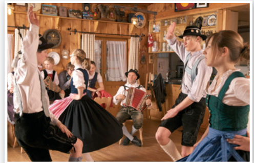
Der Trachtenverein zeigt einen Volkstanz.