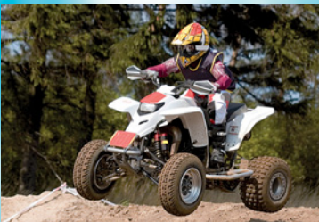
Mit dem Quad